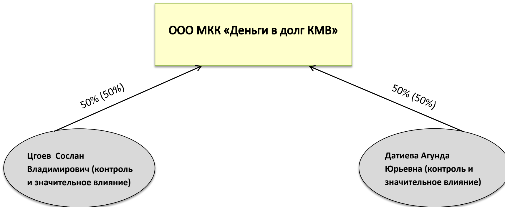
Схема взаимосвязей участников ООО МКК «Деньги в долг КМВ» и лиц, под контролем либо значительным влиянием которых находится ООО МКК «Деньги в долг КМВ»